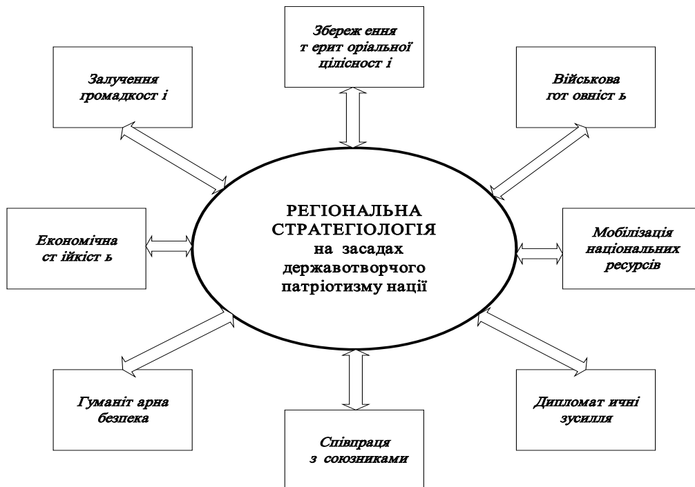
Рис. 2. Взаємозв'язок об'єднавчо-комплексних стратегій в регіональній стратегіології з позиції пріоритетності державотворчого патріотизму нації в умовах воєнного стану